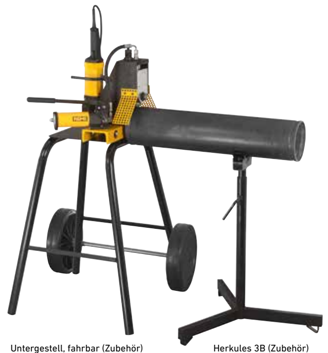
Untergestell, fahrbar (Zubehör)