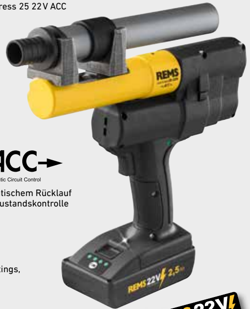
REMS Ax-Press 25 22V ACC

Verschiedene Rohraufweiter und komplettes Sortiment REMS Aufweitköpfe für alle gängigen Druckhülsen-Systeme (Seite 273 – 277).