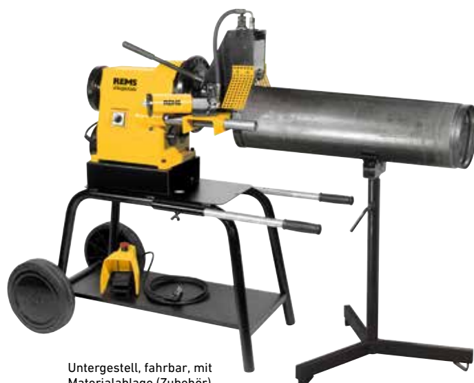
Untergestell, fahrbar, mit Materialablage (Zubehör)