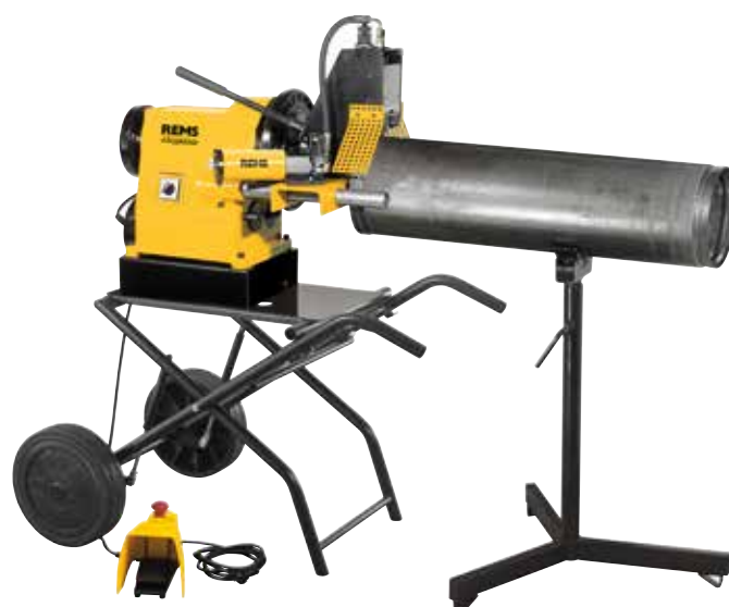
Untergestell, fahr- und klappbar (Zubehör)