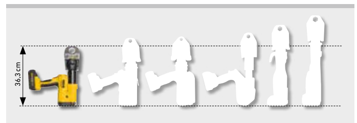
Die Kleine unter den Großen. Nur 3,4 kg.