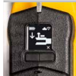
Schließstellung des Zangenhaltebolzens elektrisch überwacht.