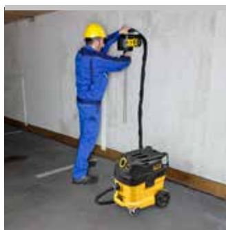
Zertifizierte Sauger und Entstauber zur Aufnahme gesundheitsgefährdender Stäube nach EN 60335-2-69.