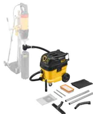
Saugen von gesundheitsgefährdenden Stäuben beim Trockenbohren: REMS Pull 2 M Set D