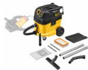
Saugen von gesundheitsgefährdenden Stäuben beim Trennen und Schlitten: REMS Pull 2 M Set