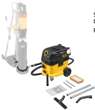
Saugen von Bohrschlamm beim Nassbohren mit REMS Bohrständen: REMS Pull 2 L Set W