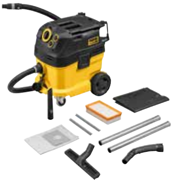
REMS Pull 2 M Set