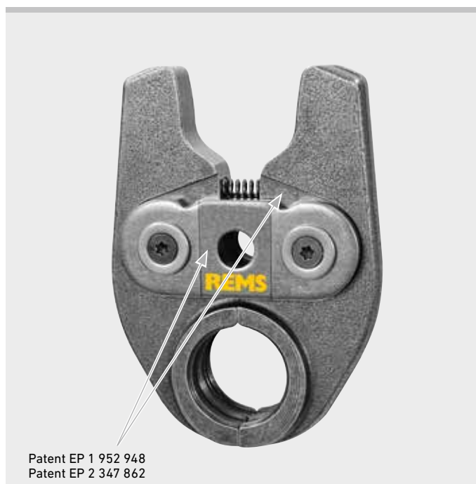
Patent EP 1 952 948 Patent EP 2 347 862

Med denne sporbarhed opfylder REMS anbefalingerne i EU norm EN 1775:2007 ved installation af pressfittings til gas.