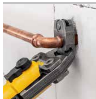
REMS pressring S (PR-2B), kan drejes trinløst