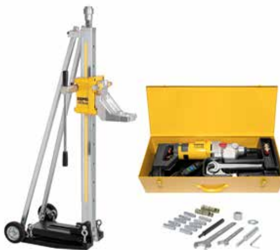
REMS Picus S3 sæt Titan