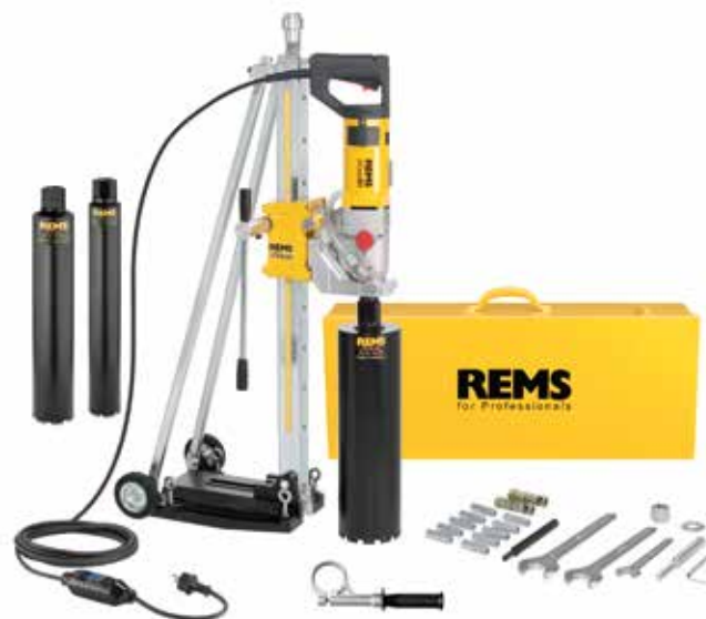
REMS Picus S3 sæt 62-82-132 Titan