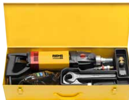
REMS Picus SR Basic-Pack

Volitelně použitelný vrtací stojan REMS Simplex 2 nebo REMS Titan (strana 310).