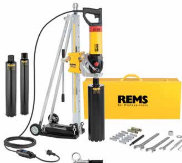
REMS Picus SR Set 62-82-132 Titan