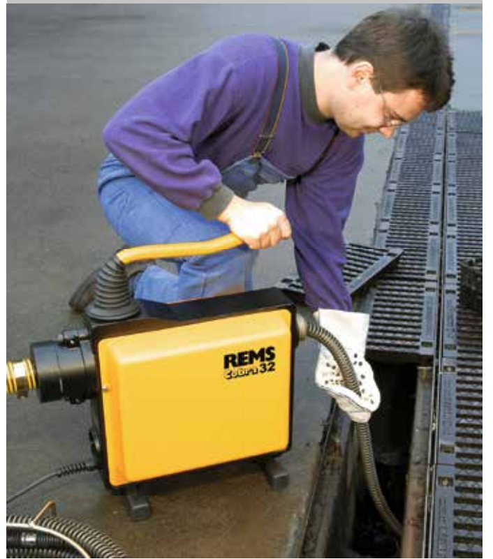
Alman Kalite Ürünü