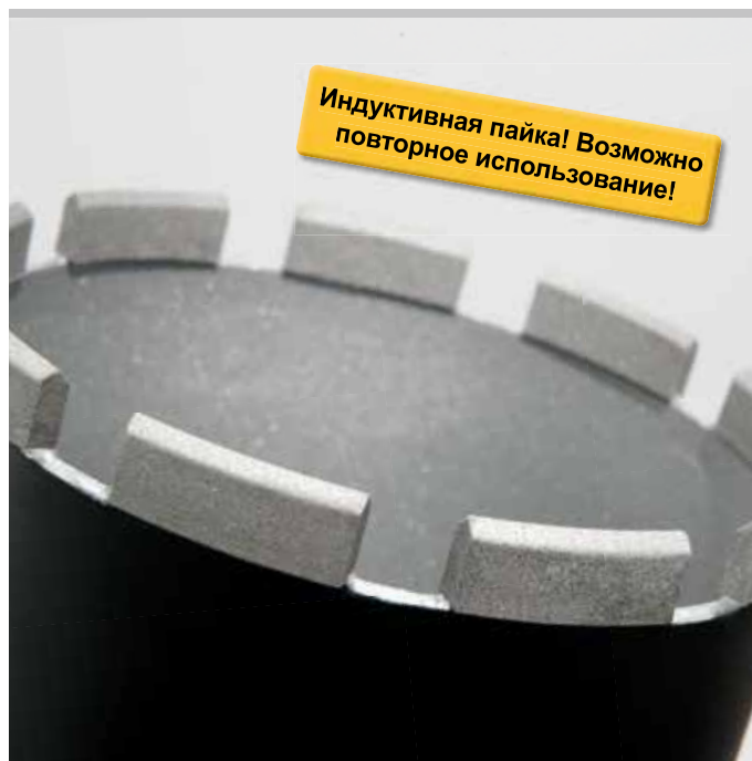
Продукция немецкого производства

Адаптеры для использования алмазной кольцевой коронки REMS LS с приводами других производителей - по запросу.