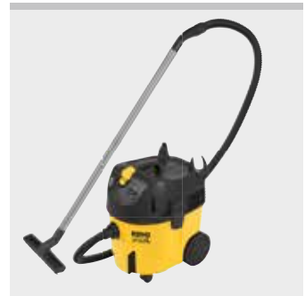
Сертифицированные пылесосы и пылеуловители для работы с опасной для здоровья пылью по EN 60335-2-69.