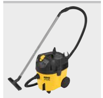
Сертифицированные пылесосы и пылеуловители для работы с опасной для здоровья пылью по EN 60335-2-69.