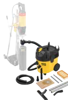
Улавливание опасной для здоровья пыли при сухом сверлении: REMS Пуль M Сет D