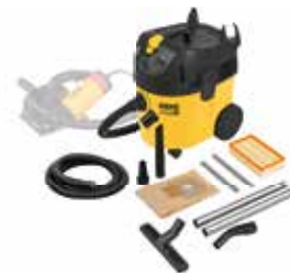
Улавливание опасной для здоровья пыли при резании и шлицевании: REMS Пуль M Сет