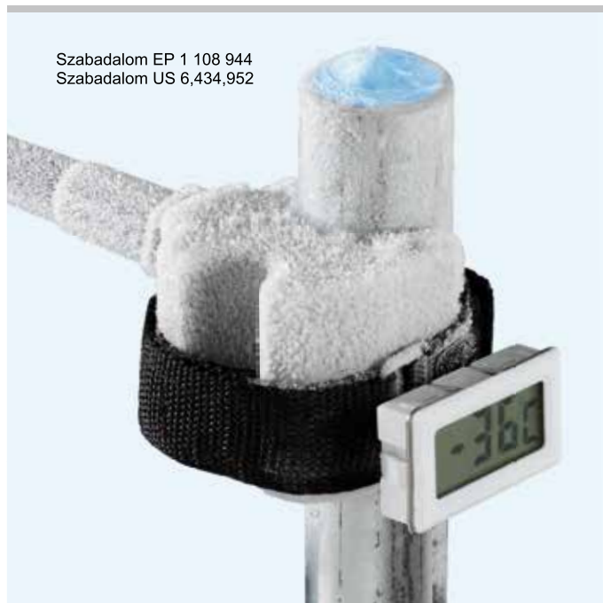
Szabadalom EP 1 108 944 Szabadalom US 6,434,952

LCD-digitális hőmérő záró fogantyúval a pontos hőmeghatározásért a megfagyasztott helyeken is.