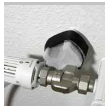
Német minőségi termék