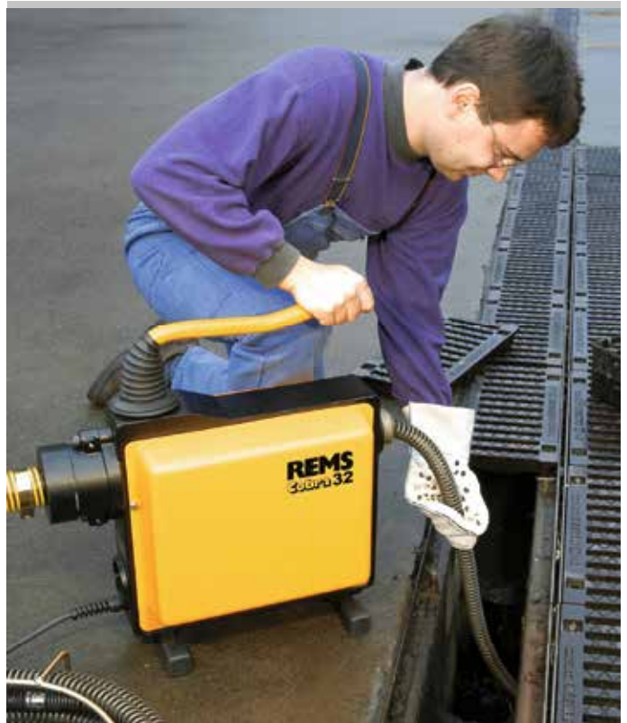
Német minőségi termék