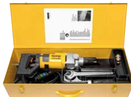
REMS Picus S1 Basic-Pack