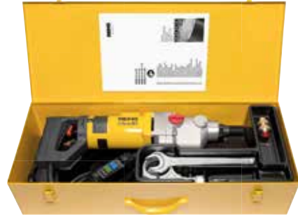
REMS Picus S3 Basic-Pack