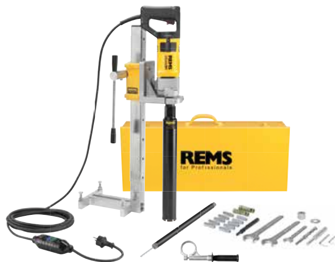
REMS Picus S1 Set 62 Simplex 2