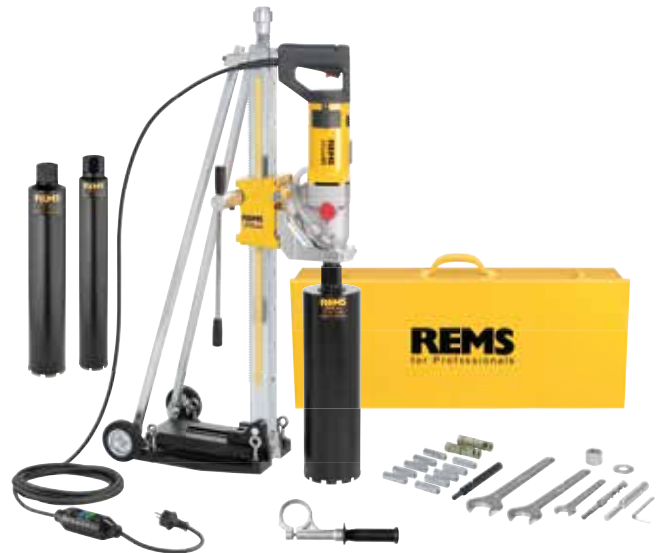
REMS Picus S3 Set 62-82-132 Titan