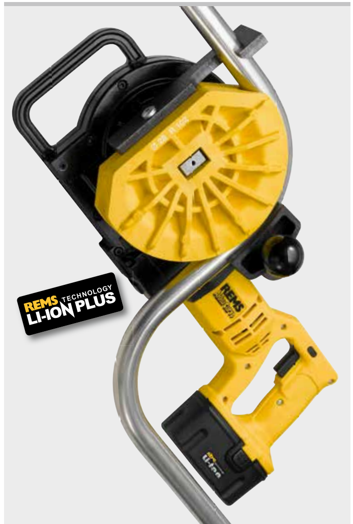
Produit allemand de qualité

Le spray de cintrage REMS garantit une pellicule lubrifiante pour une dépense réduite d'énergie et un cintrage régulier. Résistant à la haute pression et exempt d'acide. Inoffensif pour l'ozone.