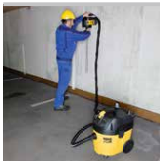
Certificeret støvsuger og støvfjerner til at optage sundhedsfarligt støv iht. EN 60335-2-69.