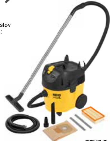
REMS Pull L Set