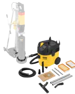
Sugning af boreslam ved vådboring med REMS borestandere: REMS Pull L Set W