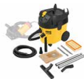
Sugning af sundhedsfarligt støv ved skæring og rilleskæring: REMS Pull M Set