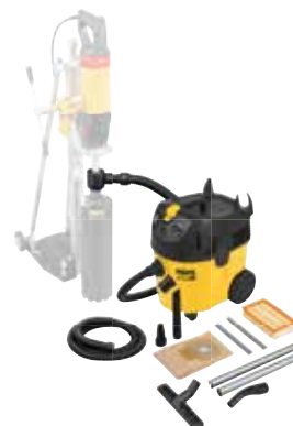
Sugning af sundhedsfarligt støv ved tørboring: REMS Pull M Set D