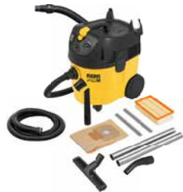
REMS Pull M Set